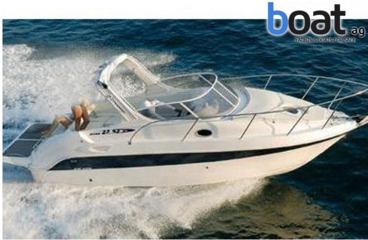
vanjski izgled - slika 1