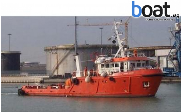
Esterni - Foto 1