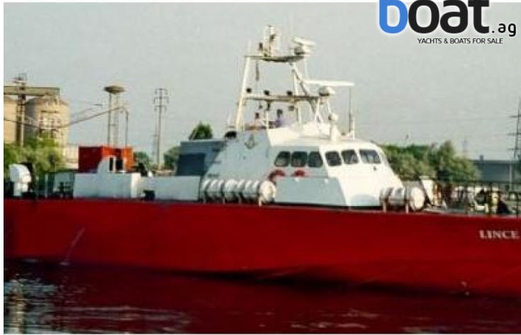
Esterni - Foto 1