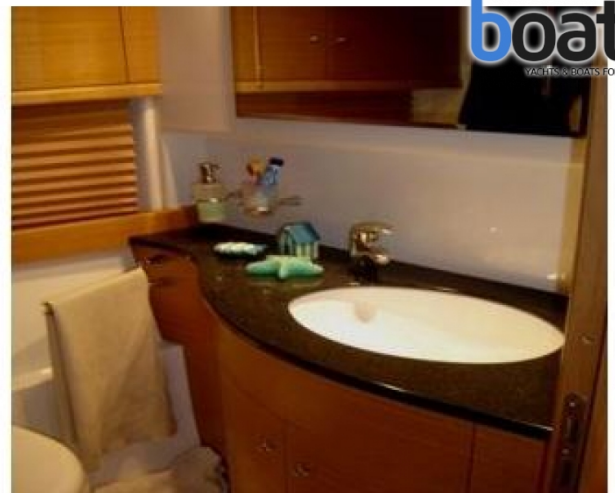
Esterni - Foto 4