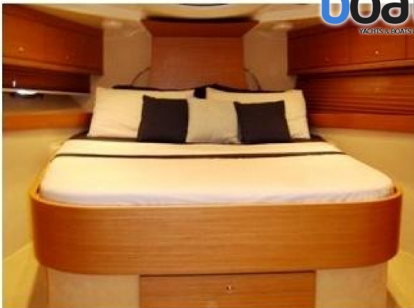
Esterni - Foto 3