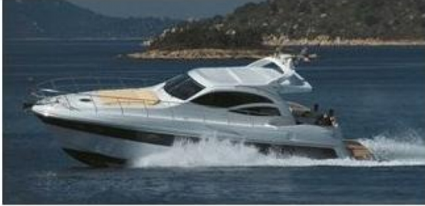
Esterni - Foto 1