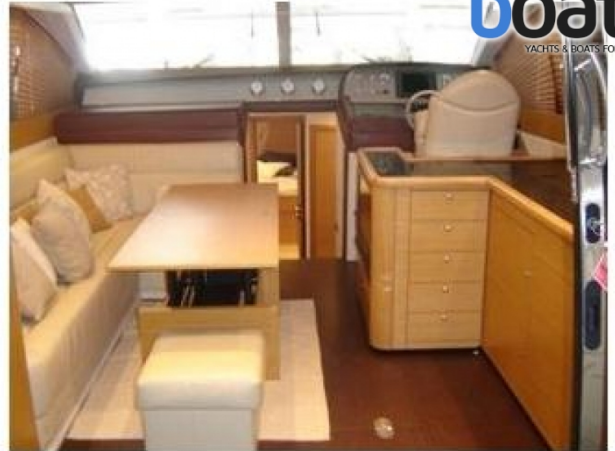
Esterni - Foto 2