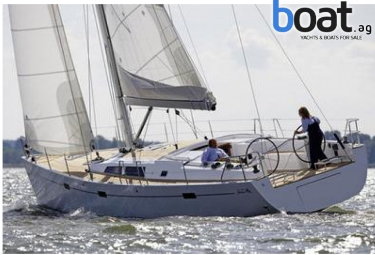
Aussenansicht - Bild 1