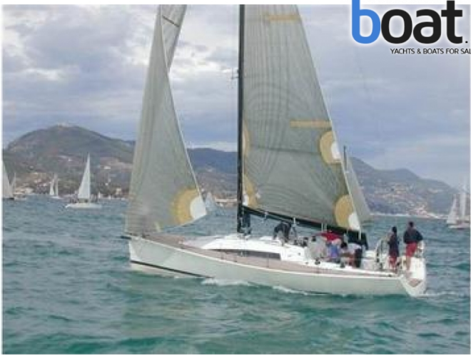
Esterni - Foto 1