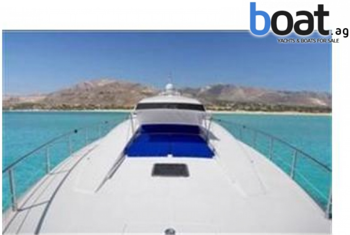
exterior - imagen 1