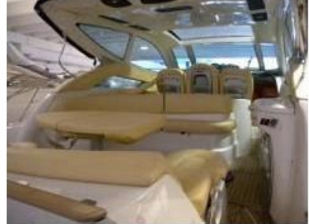
Esterni - Foto 2