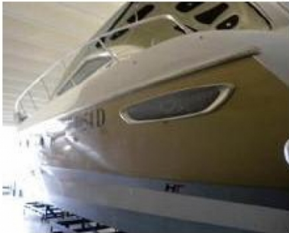
Esterni - Foto 3