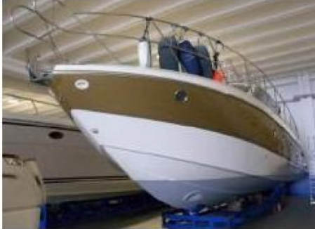
Esterni - Foto 1