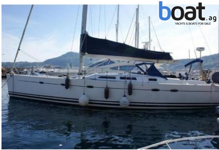
Esterni - Foto 1