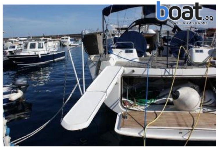
Esterni - Foto 2