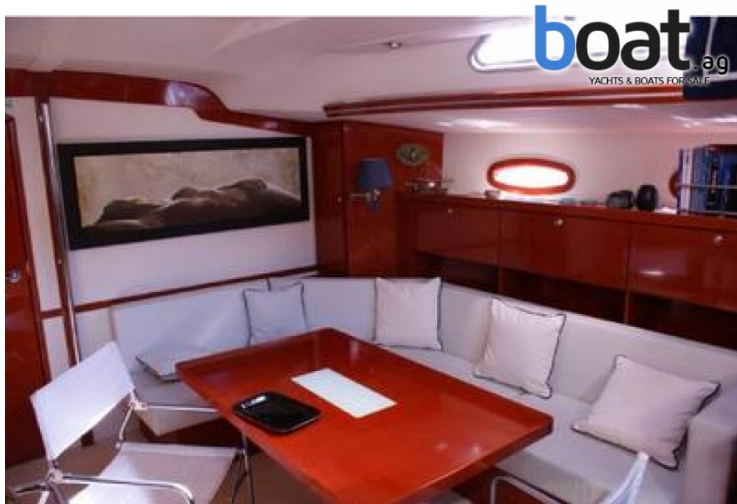
Esterni - Foto 3