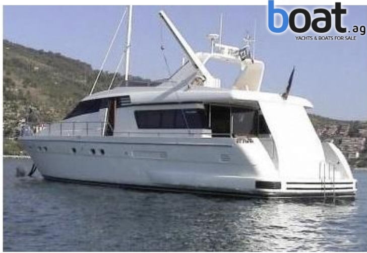
vanjski izgled - slika 1