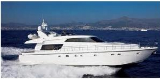
vanjski izgled - slika 3