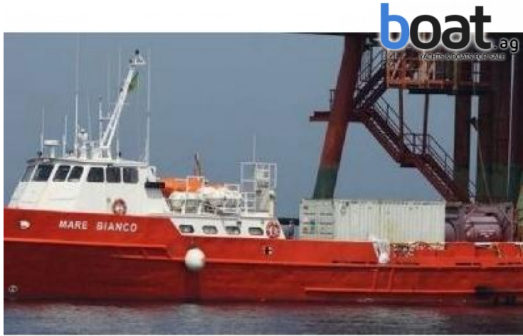
exterior - imagen 1