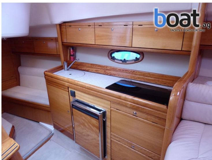
unjutrarnji izgled - slika 5