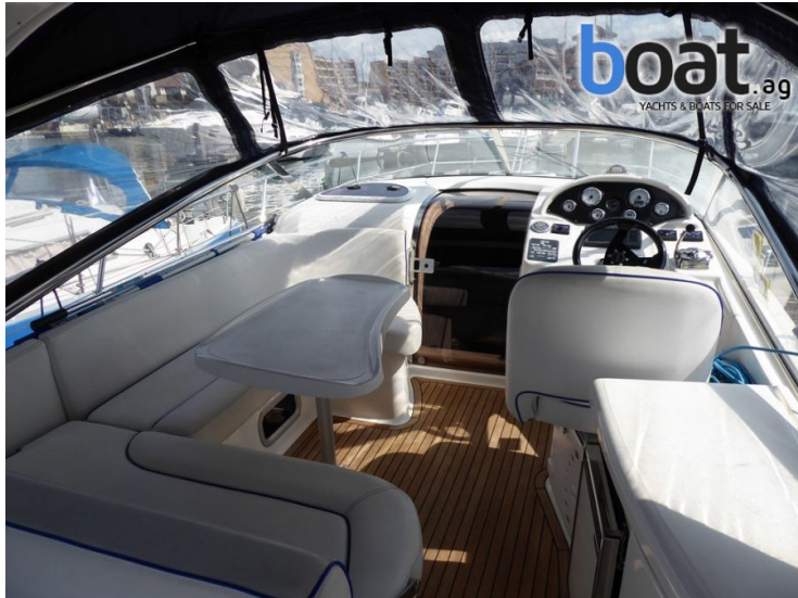
vanjski izgled - slika 7