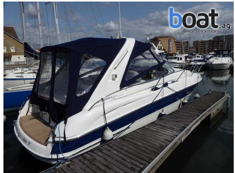
vanjski izgled - slika 2