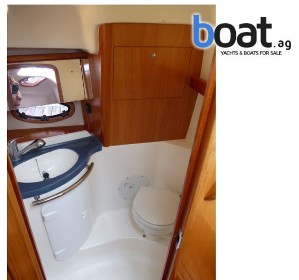
unjutrarnji izgled - slika 6