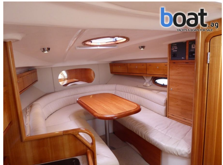
unjutrarnji izgled - slika 4