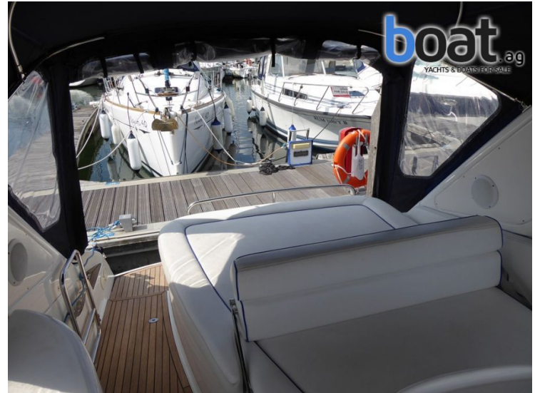
vanjski izgled - slika 8