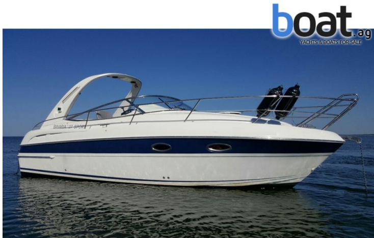
vanjski izgled - slika 1