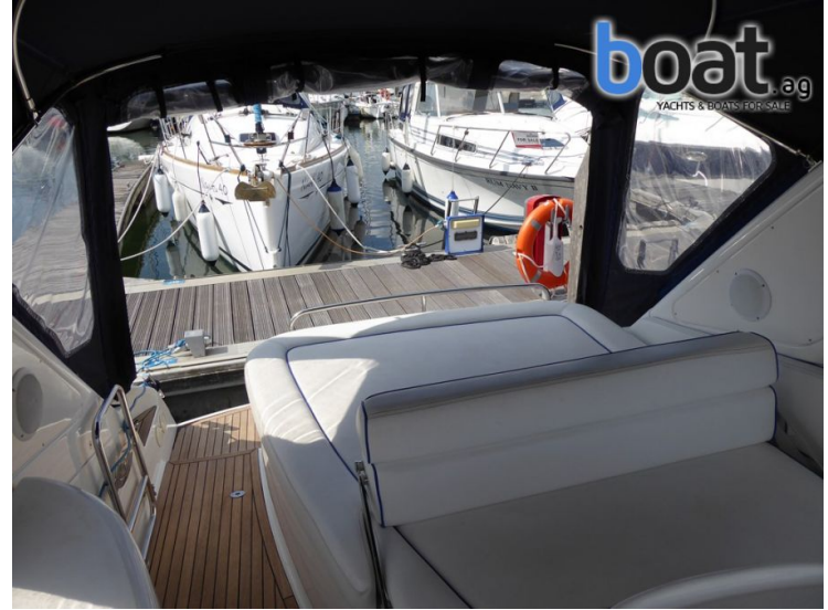
exterior - imagen 8