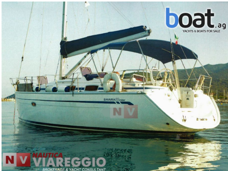
vanjski izgled - slika 1