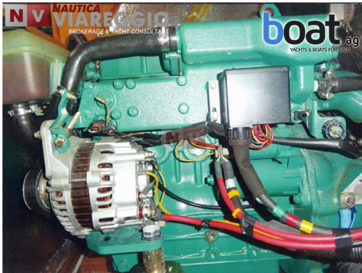
vanjski izgled - slika 7