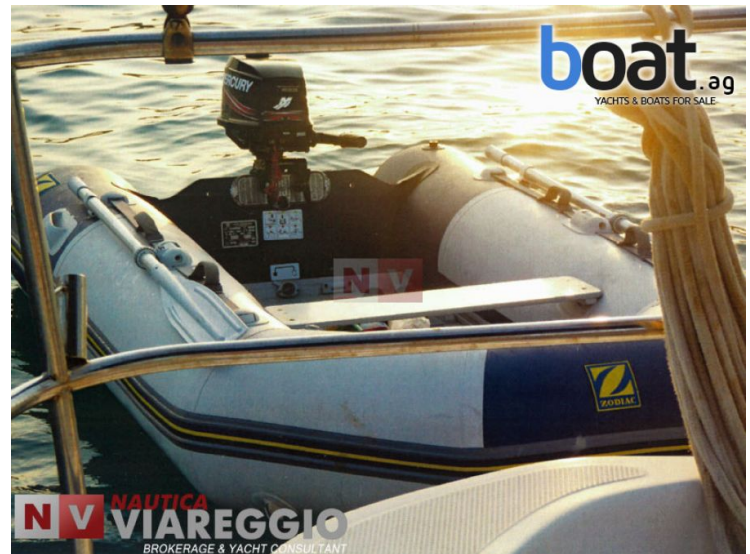
vanjski izgled - slika 8