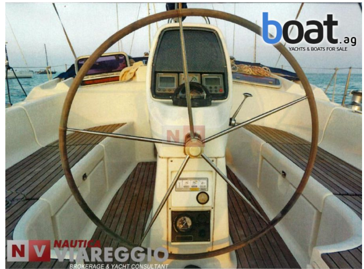
vanjski izgled - slika 2