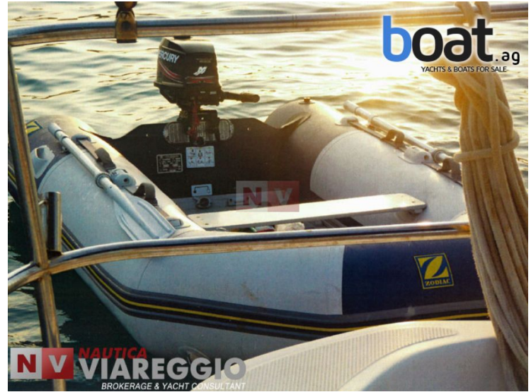
exterior - imagen 8