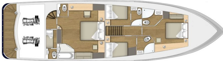
unjutrasnji izgled - slika 7