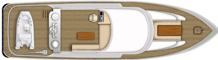
unjutrasnji izgled - slika 9