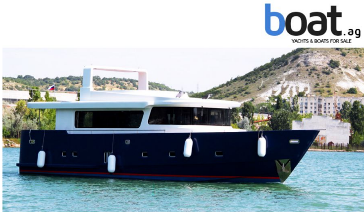
vanjski izgled - slika 1