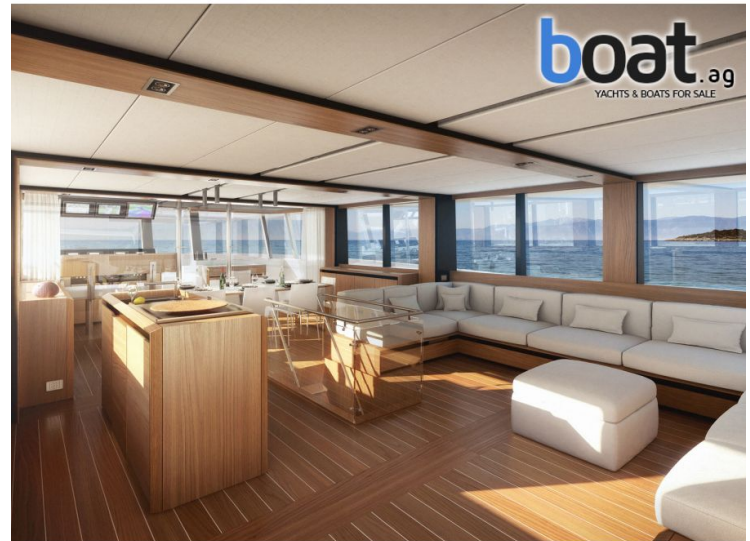
salón - imagen 8