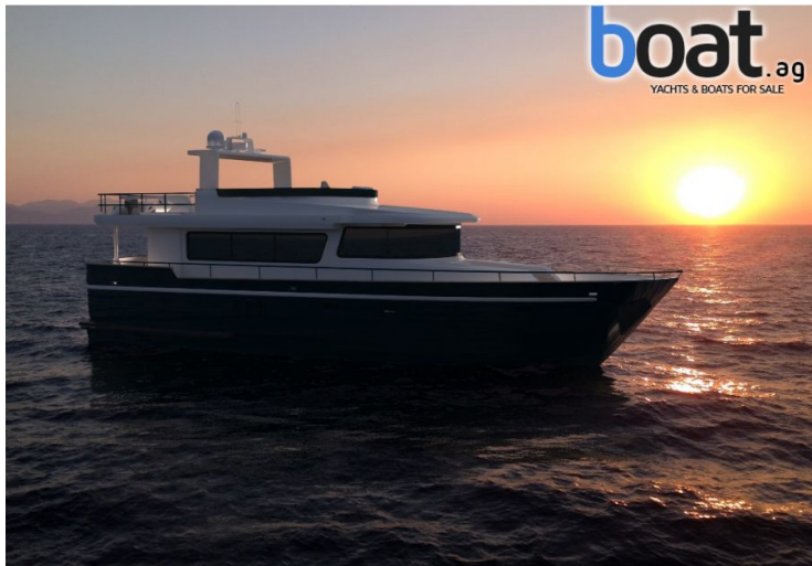
Aussenansicht - Bild 3