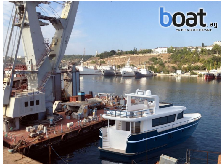
Aussenansicht - Bild 4