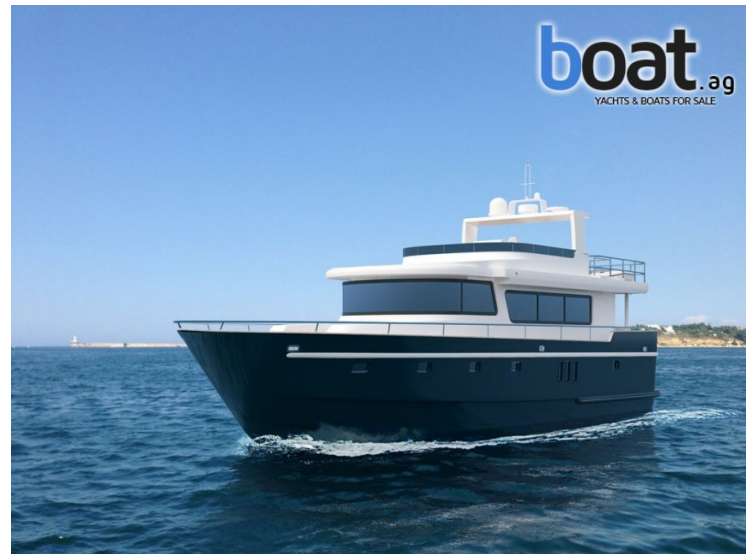
Aussenansicht - Bild 2