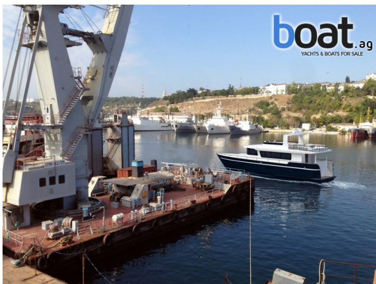
Aussenansicht - Bild 5