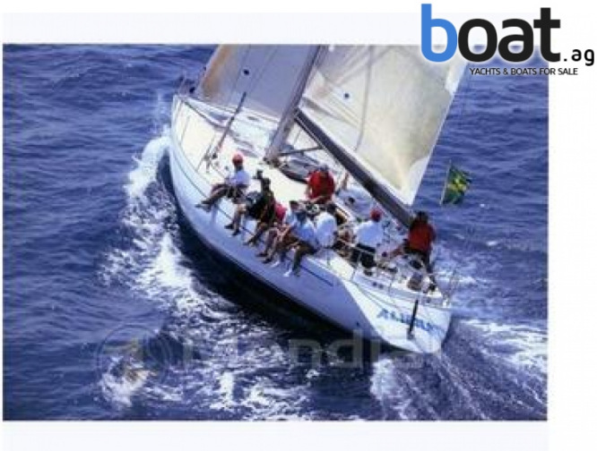
Esterni - Foto 1