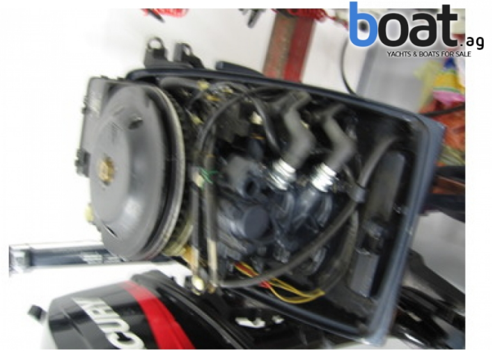
Aussenansicht - Bild 2