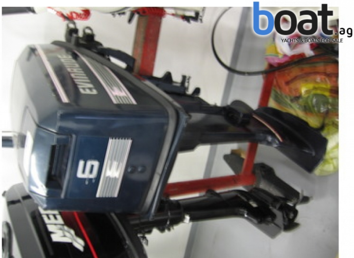
Aussenansicht - Bild 3