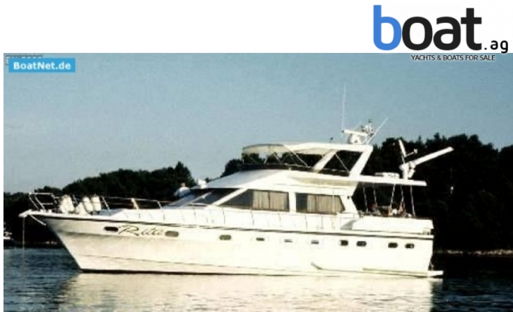
vanjski izgled - slika 1