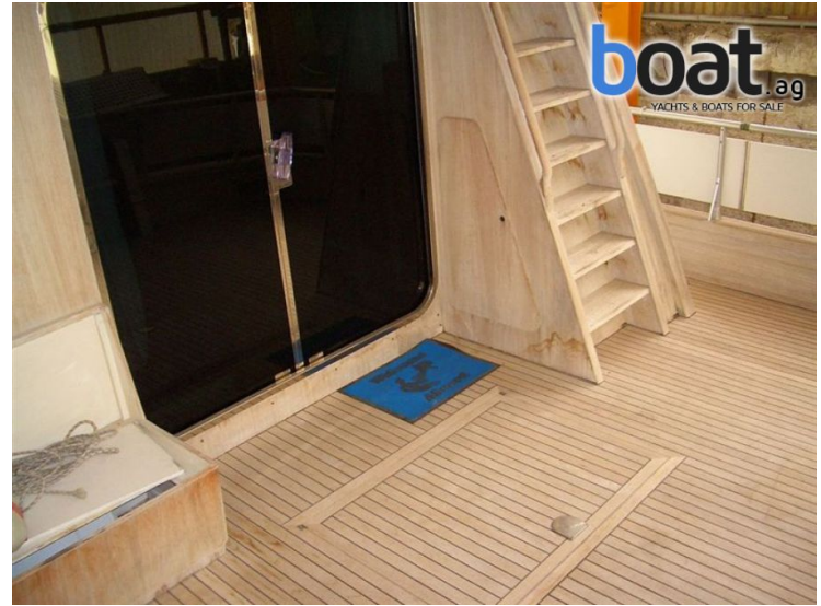
vanjski izgled - slika 2