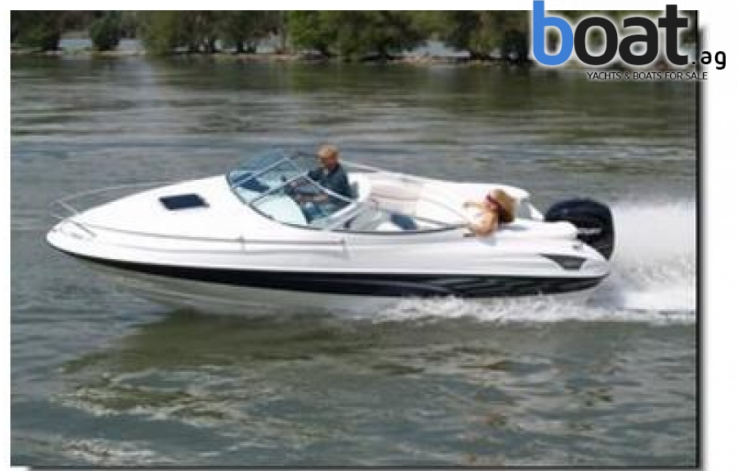
vanjski izgled - slika 2