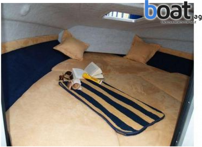
vanjski izgled - slika 1