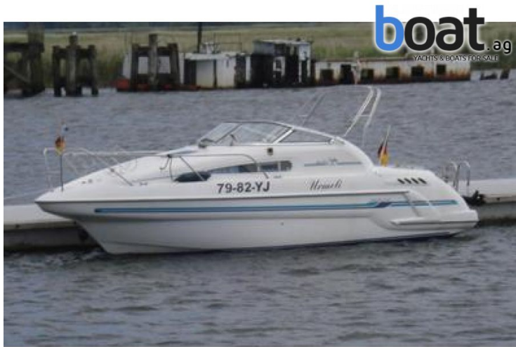
Aussenansicht - Bild 1