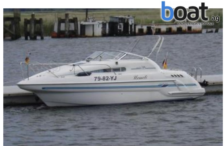
Aussenansicht - Bild 8