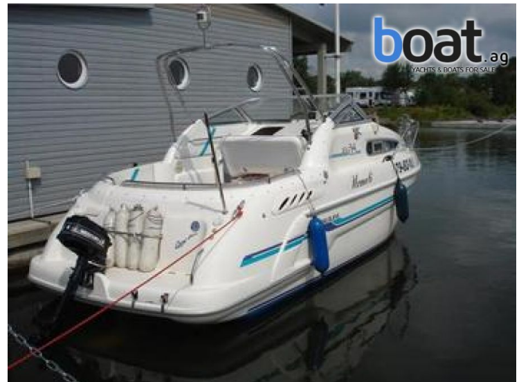
Aussenansicht - Bild 2