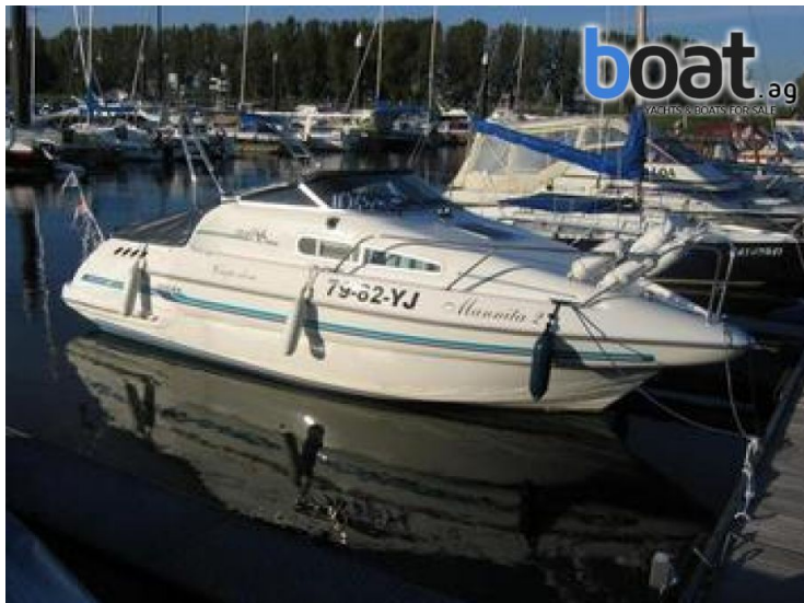
Aussenansicht - Bild 3