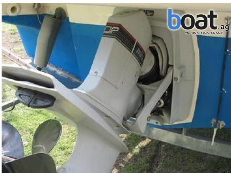
Aussenansicht - Bild 5