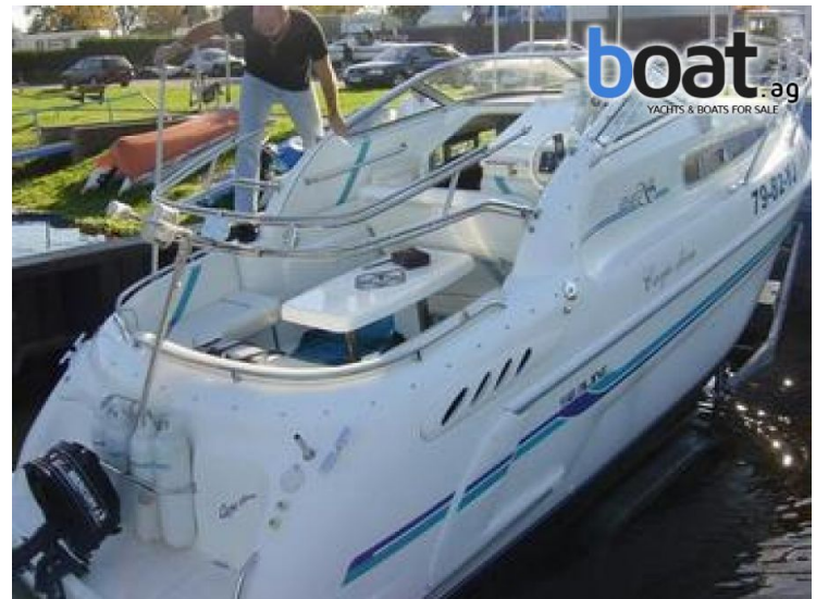
Aussenansicht - Bild 4