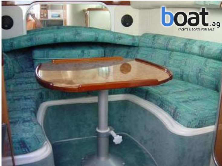
Aussenansicht - Bild 7