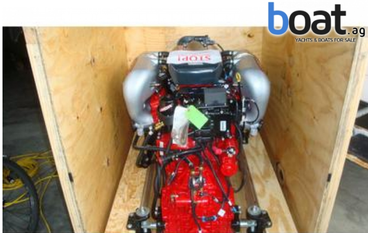
Aussenansicht - Bild 1