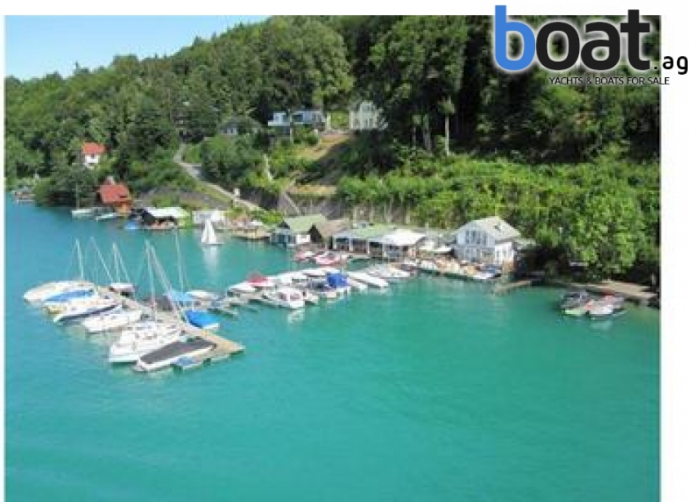
Aussenansicht - Bild 3