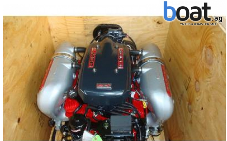
Aussenansicht - Bild 2