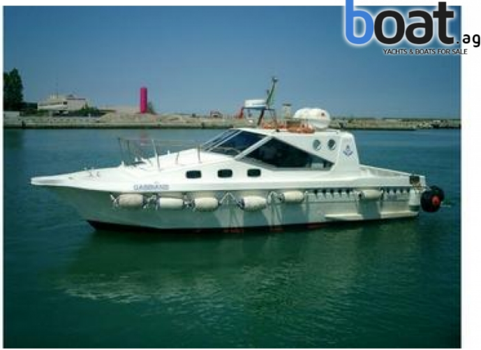
Esterni - Foto 1