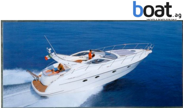
Esterni - Foto 1