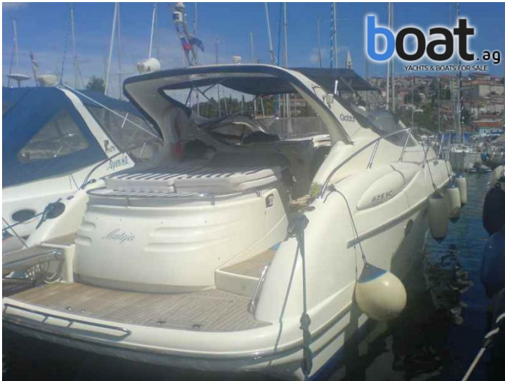
Vista dal retro - Foto 3