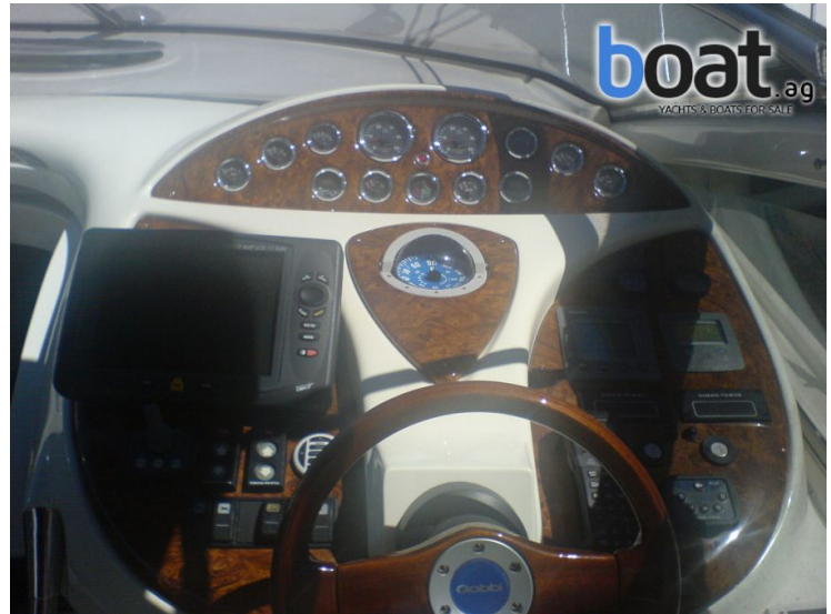
Pozzetto - Foto 4