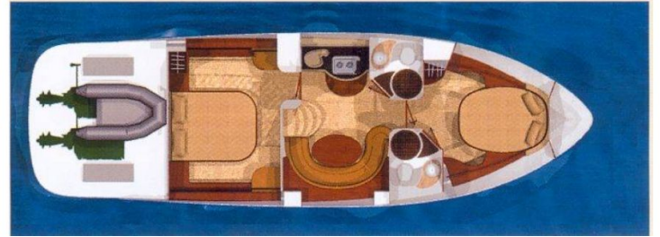
Esterni - Foto 2