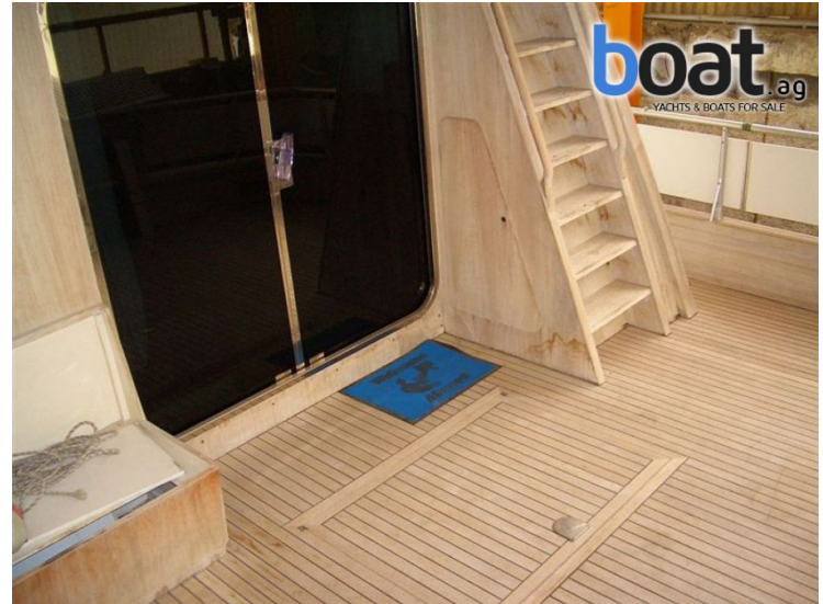
vanjski izgled - slika 2