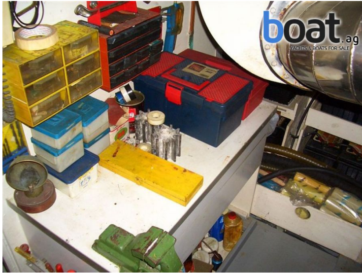
vanjski izgled - slika 7