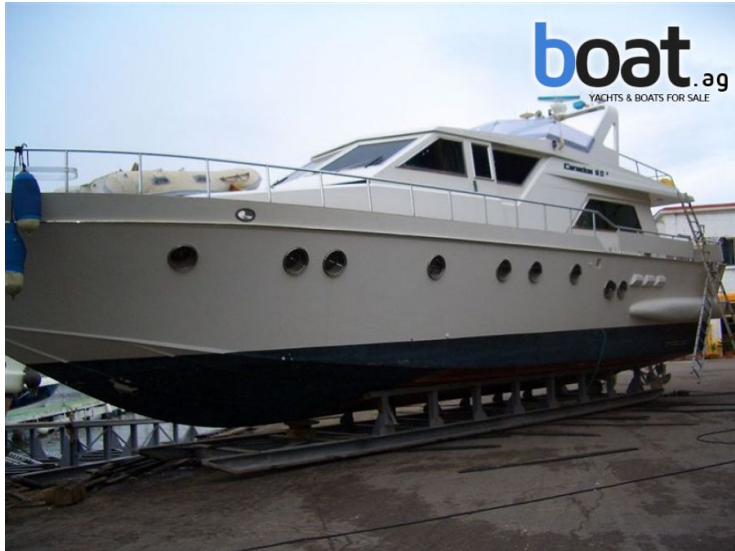
vanjski izgled - slika 1